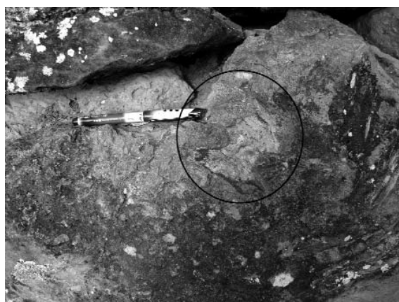
Fig. 4.- Sauropod caudal vertebra of the Mas de la Chimenea Alta.

marca del dedo IV es de 10 cm y la de la marca del dedo II de 2 cm, la anchura de la marca de los dedos es de 8 cm y 5 cm respectivamente. El ángulo entre las marcas de los dedos III-II es de 39°. Según esta descripción, consideramos que se puede relacionar la icnita a un dinosaurio ornitópodo de talla media.