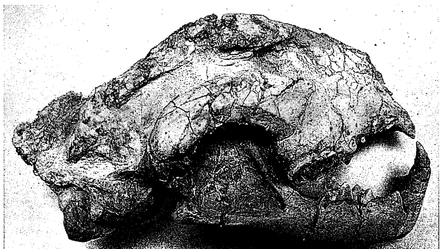
Fig 1.- Cráneo con mandíbula del tigre dientes de sable Paramachairodus ogygia del yacimiento de Batallones 1-I.

radicalmente diferente de la de los niveles inferiores de Batallones 1. El lado Este del yacimiento es vertical y está formado por sepiolita y rocas silíceas endu-