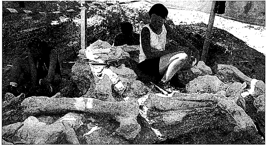
Fig. 3.- Mastodontes (fémur, tibia y autópodo) y excavadores en Batallones 2-S durante la campaña del 2000.

El yacimiento está lateralmente encajado por sepiolita y rocas silíceas endurecidas. El relleno sedimentario puede seguirse lateralmente aproximadamente unos 10 m y la potencia visible de estos sedimentos sobrepasa los 4 m. Los restos fósiles de macrofauna recuperados en el yacimiento nos indican que la asociación faunística es semejante a la de los niveles superiores de Batallones 1, con la presencia de Hipparion sp. y Tetralophodon longirostris . Esta especie de mastodonte también está presente en el nivel superior de Batallones 2. Al igual que en este último yacimiento, Batallones 5 presenta frecuencias menores de restos del rinoceronte Aceratherium incisivum . También son destacables los hallazgos de algunos restos pertenecientes a una especie de jiráfido, probablemente próxima a la hallada en Batallones 4. En resumen, los datos obtenidos hasta el momento parecen indicar la existencia de una correlación temporal, a nivel de composición faunística, entre los niveles superiores de Batallones 5 y los niveles superiores de los demás yacimientos del Cerro. La conservación de los restos y su composición anatómica son indicativos de una breve exposición subaérea. La presencia y conservación de elementos frágiles, como las apófisis y/o espinas de las vértebras pare-