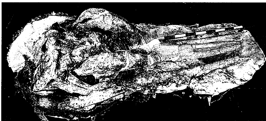
Fig. 4.- Cráneo y mandíbula del mastodonte Tetralophodon longirostris de Batallones 2-S.

Fig. 4.- Skull and mandible of the Tetralophodon longirostris mastodont from Batallones 2-S.